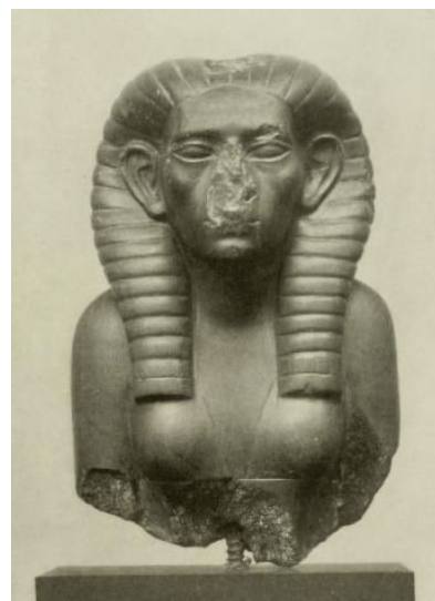
Statue de Néférousobek, jadis au musée de Berlin, aujourd'hui perdue

Tout le monde connaît les célèbres Ramses II, Akhéaton, Chéops ou encore Toutankhamon, mais la grande majorité des pharaons demeurent, même pour plusieurs égyptophiles, de simples noms sur une liste, voire de complets inconnus! Voici le retour de cette chronique de l'Escribe qui se propose de mettre en lumière quelques-uns de ces pharaons qui gagneraient à être mieux connus.